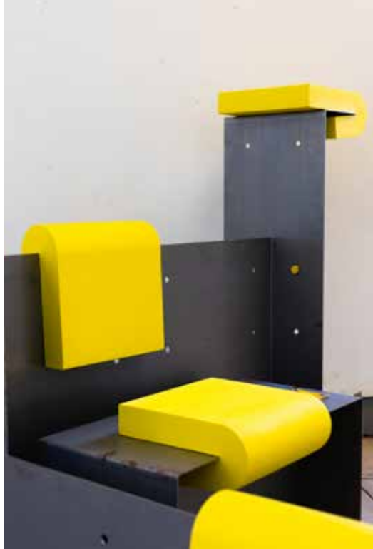
Graduation 2022