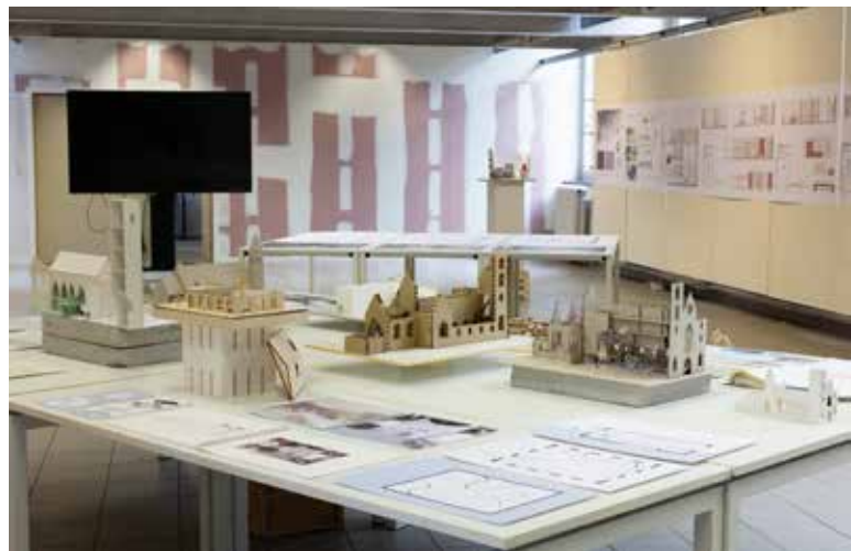
Graduation 2022, foto: Benina Hu