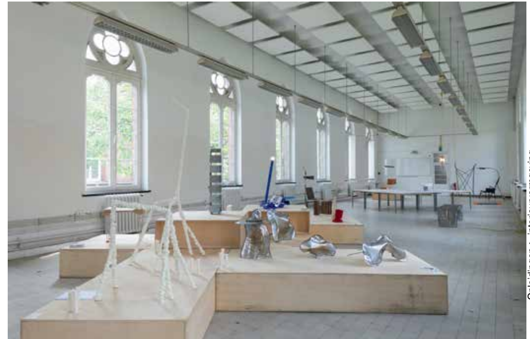
Graduation 2022