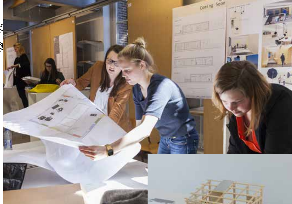
Bachelorproef / Open Ruimte Corridor Aalst