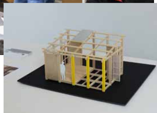
Graduation 2022