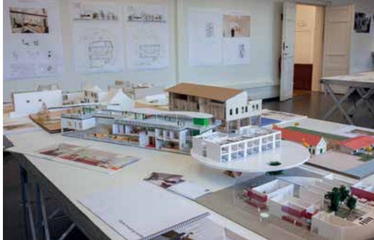
Graduation 2021