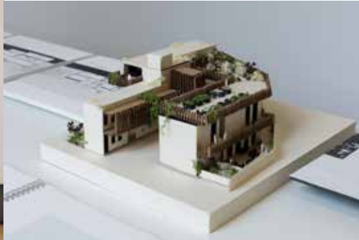
Graduation 2022