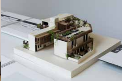
Graduation 2022