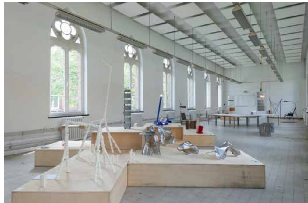
Graduation 2022, foto: Benina Hu

Binnen KASK & Conservatorium heb je de mogelijkheid om naast je studies ook actief deel te nemen aan de dagelijkse werking en het beleid van de opleiding. Je kan klasverantwoordelijke zijn en/of zetelen in de studentenraad, opleidingscommissie en de raad van de school of arts. Op die manier geef je zelf mee richting aan de opleiding en verwerf je bepaalde vaardigheden die je van pas kunnen komen in het werkveld.