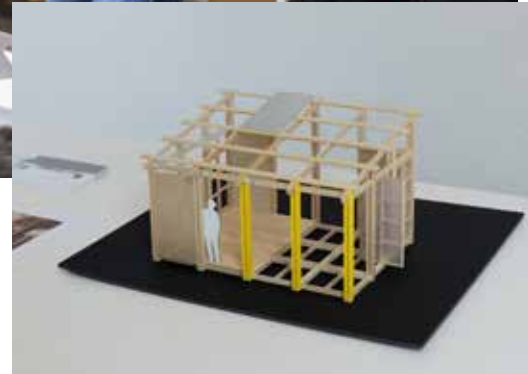
Graduation 2022