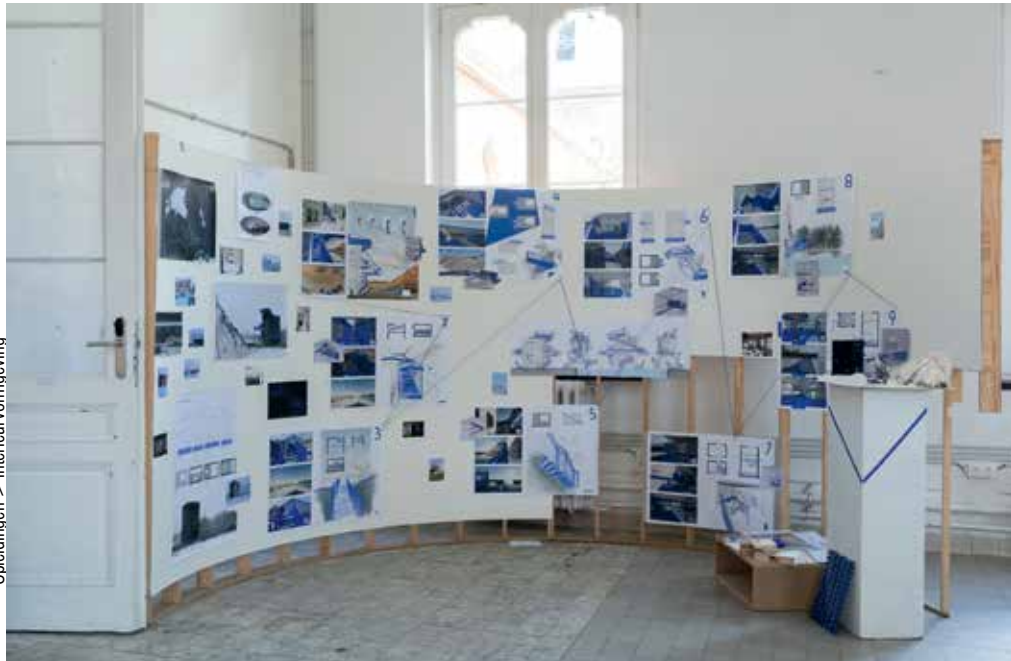
Lieze Vanlerberghe, Graduation 2022

Interieurs moet je kunnen lezen en begrijpen. Waarom heeft de ontwerper juist hier een trap gezet? Wat als het plafond een meter hoger was? Zoiets heeft weinig met vooropleiding te maken. Het is eerder een talent dat je doorheen de opleiding verder aanscherpt.