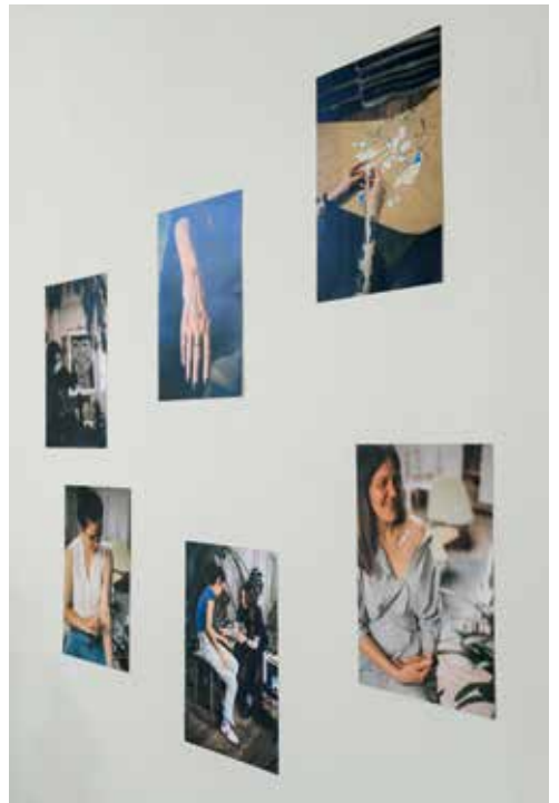
Graduation 2022